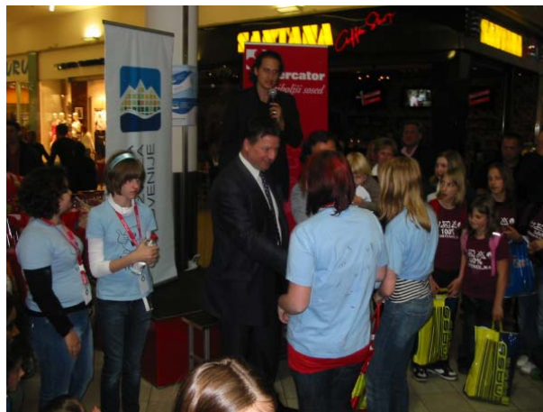
Učenci OŠ Dobrna – dobitniki zlatega priznanja v okviru projekta Turizmu pomaga lastna glava so se predstavili na zaključni prireditvi v Ljubljani.

Vsi prejemniki priznanj smo se predstavili na zaključni prireditvi, ki je bila 23. 4. 2009 v Ljubljani.