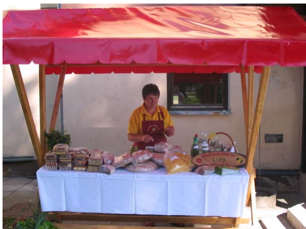
Tržnica in program ob obisku udeležencev ekskurzije

na kulturni prireditvi Srečanje z Zemljo v Kulturnem domu Vitanje ob odprtju razstave.