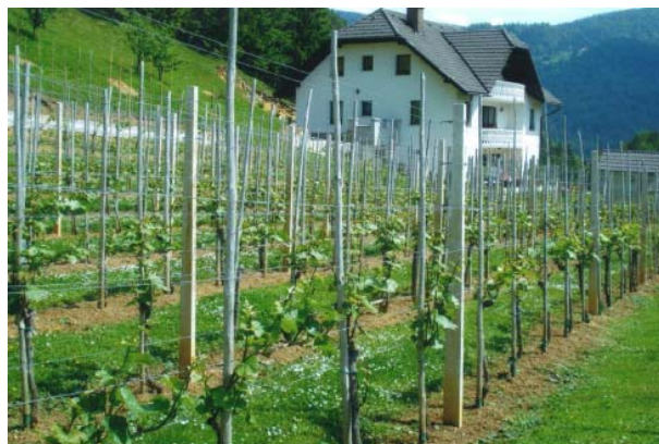
V Parožu 17, kjer raste in zori Modri pinot

Po tem, ko je vse kazalo, da se tudi vinogradnikom na področju Občine Dobrna obeta ena boljših vinskih letin, je neurje soboto popoldne, 23. avgusta, z debelo točo in močnim vetrom uničilo kar polovico pridelka. Veliko truda in stroškov je bilo potrebno, da so lahko to, kar je ostalo, obdržali do trgatve. Lepa jesen pa je pripomogla, da je grozdje dozorelo in mošt se je spremenil v vino.