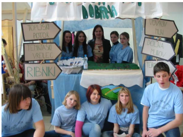
Predstavitve turistične raziskovalne naloge učencev OŠ Dobrna, Celje.