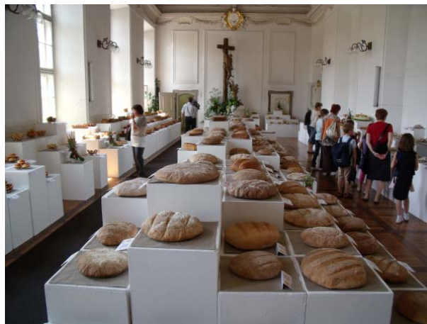
Z razstave na Ptuju: Kruh naš vsakdanji

katere smo seveda ponosne. To je dokaz, da tudi vitanjske kmetice znamo pripraviti kakovostne izdelke, s katerimi večkrat popestrimo kulinarčno ponudbo. Sama cenim in spoštujem trud in znanje, ki ga vse kmetice vlagamo za dvig kulinarčne ponudbe izdelkov, ki jih pripravljamo na tradicionalni način. Želim, da bi tudi slovenski potrošniki znali ceniti po domače pripravljeno slovensko hrano.