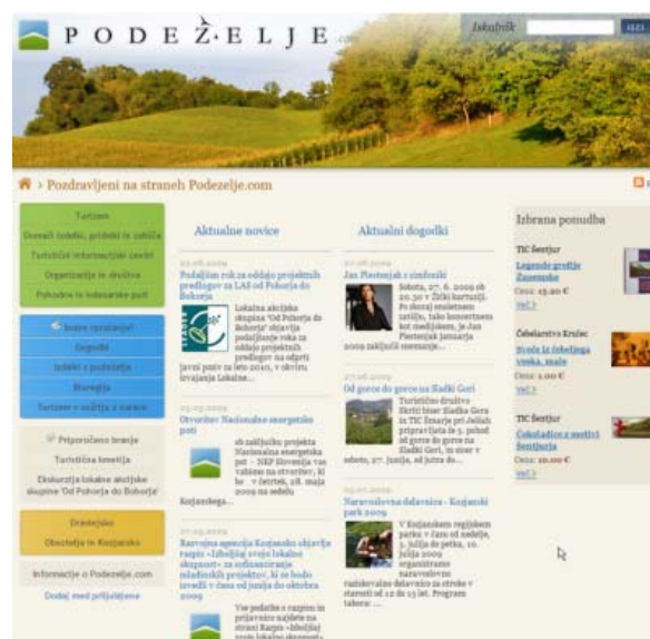
Spletni portal Podezelje.com

V okviru projekta smo vzpostavili tudi »Zbiralnico idej« , ki bo na spletni strani Podezelje.com objavljena v prihodnjih tednih. Tu bomo zbirali ideje in predloge za nadaljnji razvoj območja. Posamezniki in organizacije bodo lahko videli pripravljene ideje za razvoj svojega okolja, zbirali pa bomo tudi nove predloge in ideje, ki jih bodo prispevali prebivalci z območja.