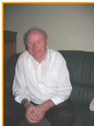
Franc Salobir, župan

Površina občine: 17 km 2 Število prebivalcev: 1.011