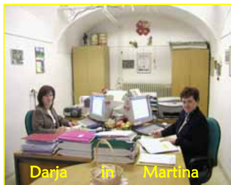
Darja in Martina

Stari trg 29 3210 Slov. Konjice T: 03/759 31 10 F: 03/ 759 31 11 M: 031/411 080 E: giz.sk@siol.net I: www.slovenskekonjice.si