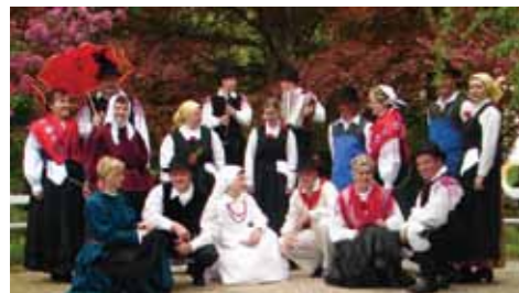
Folklorna skupina KUD Dobrna

Generacije plesalcev folklorne skupine Dobrna so od ustanovitve leta 1950 pa vse do danes ohranjale bogato izročilo ljudskih plesov. To je bila prva organizirana folklorna skupina na Celjskem. Sestavljajo jo pretežno domačini, ki vztrajajo zaradi veselja do plesa in druženja.