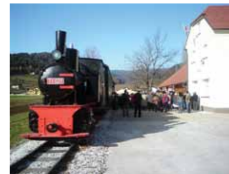
Otvoritev prenovljene železniške postaje v Zrečah

V okviru projekta sta bila izvedena peskanje in antikorozijska zaščita obstoječe vlakovne kompozicije, obnovljen je bil peronski del in