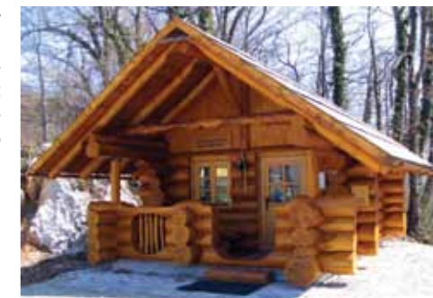
Turistična hiška pod Arheološkim parkom Rifnik

Vrh Rifnika je eden največjih in najlepše urejenih zgodovinskih parkov v Sloveniji, ki izpričuje poseljenost vse od kamene dobe do pozne antike, ko so si rimski staroselci na južnem pobočju postavili enostavne kamnite hiše.