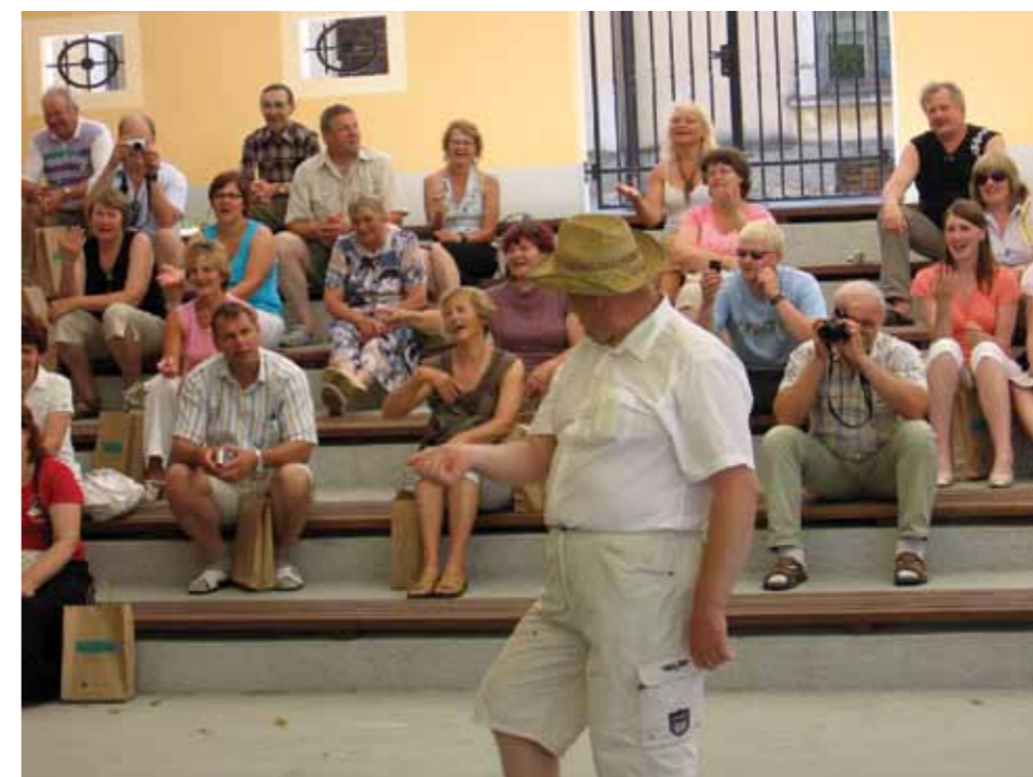
Estonci so se na obisku zabavali navkljub nevajenosti hribovitosti našega območja

Nerda, z glavnim sedežem v Tuzli, je vodilna organizacija za socialno-ekonomski razvoj severovzhodne Bosne z vizijo vzpodbujanja trajnostnega in skladnega razvoja celotne regije, ustvarjanja boljših delovnih in življenjskih pogojev ter možnosti za vse.