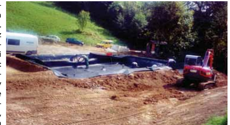
Gradnja rastlinske čistilne naprave v Dobju

učinkovitosti in izrabo obnovljivih virov energije. Razstavljalci iz 12 različnih podjetij so predstavili naslednje teme: izkoriščanje obnovljivih virov energije (sončne elektrarne in solarni kolektorji), ogrevanje (kotli na biomaso, soproizvodnja toplotne in električne energije, toplotne črpalke, nizkotemperaturno ogrevanje, ogrevalni sistemi, itd.), izkoriščanje deževnice, klimatizacija in prezračevanje, ovoj stavbe (sodobna okna, vrata in strehe), energetske učinkovite razsvetljave ter ostale energetske učinkovite naprave, produkti in storitve. V okviru sejma je bilo zagotovljeno tudi brezplačno svetovanje energetske svetovalcev, med drugim tudi o ugodnih EKO kreditih in nepovratnih sredstvih.