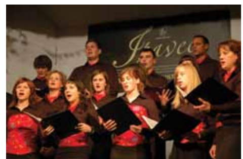
MPZ Zarja Akvonij

Prav tako je opaziti trend razvoja turističnih društev v občini. Med aktivnimi društvi z daljšo tradicijo je potrebno omeniti Turistično društvo Gorica pri Slivnici, ki vsako leto organizira Kresno noč ob Slivniškem jezeru, Društvo Izviri, ki med drugim s prireditvami, kot so Valentinov nočni pohod, Moja dežela, lepa in gostoljubna ter Ohranimo kulturno dediščino naših babic in dedkov, skrbi za turistično dogajanje v Loki pri Žusmu, in Turistično olepševalno društvo Ponikva, ki poleg zaščite in urejanja rastišča velikonočnice, kostanjevega drevoreda in učnih poti na Ponikvi prireja tradicionalne Martinove dneve. Med novoustanovljenimi društvi sta aktivna Turistično društvo Blagovna in Turistično društvo Dolga Gora, spodbudna pa je novica, da je v ustanavljanju Turistično olepševalno društvo Šentjur.