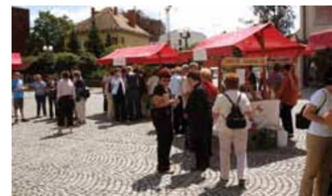
Dan turizma na Mestnem trgu

Trg so v turistične barve najprej odeli najmlajši ustvarjalci – otroci iz konjiških vrtcev, ki so na ploščadi pred Domom kulture izdelovali konjičke, sončnice ter podstavke za kozarce v barvah konjiške občine. Predstavniki TD Jurjeva Konjenica so nekatere otroke popeljali na kratko panoramsko vožnjo po trgu s konjičkoma. Na stojnicah so se predstavile tudi turistične agencije, ki delujejo v občini, Vinogradniško vinarsko društvo Slovenske Konjice ter TIC Slovenske Konjice. 18 lokalnih