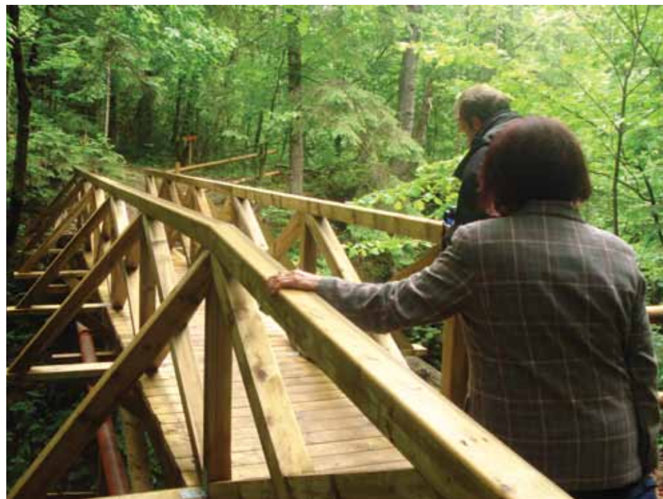
Urejene pohodne poti po Oplotniškem vintgarju