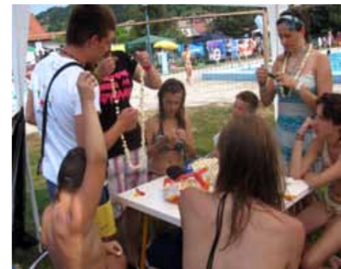
Izdelovanja nakita na šentjurskem bazenu

Mladinski center je med sabo povezal 9 lokalnih modnih oblikovalcev oblek, nakita, obutve in drugih modnih dodatkov. V mesecu juniju so pripravili modno revijo ter izdali skupen modni katalog.