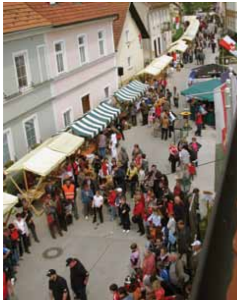
Glavno prizorišče Šentjurjevega v Zgornjem trgu

Na svoj račun so prišli najmlajši, saj so jih na Jurčkovanju zabavali Čuki, uživali pa so lahko tudi v predstavi Razbojnik Cefizelj in butalska pamet. V soboto se je v Zgornjem trgu v Šentjurju že zjutraj začel Šentjurjev sejem , na katerem so bili predstavljeni izdelki domače in umetne obrti, domače dobrote in ostali izdelki, ki izvirajo ali so povezani s slovenskim podeželjem. Športniki so se lahko