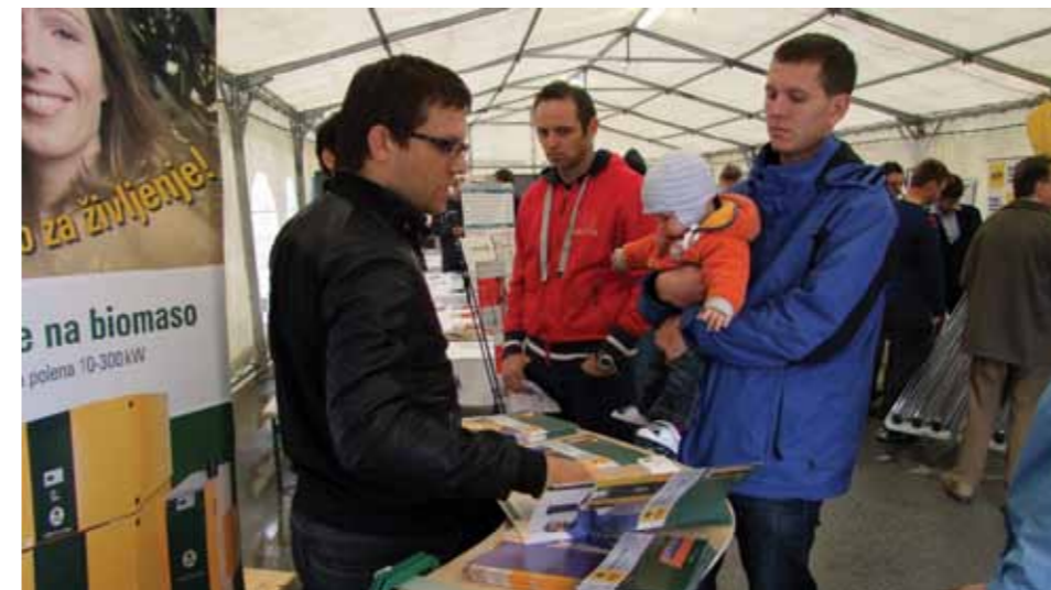
Gozdnatost tudi na območju LAS "Od Pohorja do Bohorja" omogoča lažji in cenejši dostop do lesne biomase

Aktivnosti za rastlinsko čistilno napravo so pričele teči leta 2008 z odkupom potrebnega dela zemljišča zanjo. V letu 2009 je Občina Dobje pristopila h gradnji čistilne naprave. Trenutno je v fazi priprave projektne dokumentacije za izgradnjo kanalizacijskega sistema. Po prejemu le-te, bo občina pristopila k izboru izvajalca. Dokončanje projekta je predvideno v letu 2011.