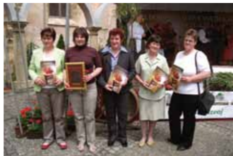
Članice društva na 21. Dobrotah slovenskih kmetij