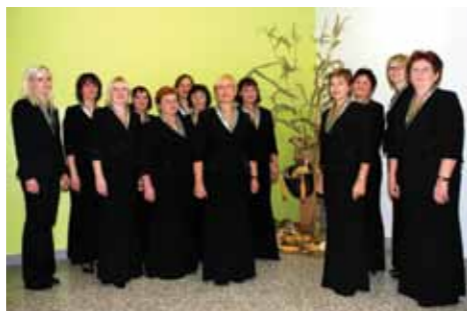
Ženska vokalna skupina KUD Dobrna

Ženska vokalna skupina Dobrna je v kulturnem življenju kraja najbolj prepoznavna po dveh prireditvah – Valentinovem in Martinovem koncertu, ki sta odlično zastavljena in med ljudmi dobro sprejeta. Odlikujejo jih predvsem predanost pesmi, odgovornost za kvaliteto petja in veselje do druženja v skupini. Ob letošnjem občinskem prazniku je skupina prejela bronasti grb Občine Dobrna .