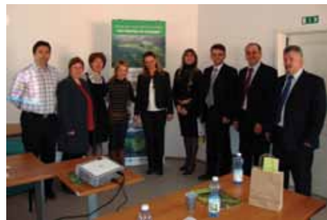
Predstavniki iz Tuzle na obisku RA Kozjansko

Gostje so se sestali z našimi predstavniki z namenom izmenjave izkušenj in možnega prihodnjega sodelovanja. Predvsem so jih zanimala naše izkušnje v zvezi s črpanjem evropskih sredstev, delovanja občin in razvojnih agencij ter možnosti pridobivanja sredstev za razvoj njihovega območja.