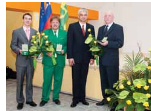
Godbeniki ob prejemu občinskega priznanja

Sedanje Društvo godbenikov Zreče je bilo ustanovljeno v začetku leta 2004, čeprav je v Zrečah godba obstajala že pred 40. leti. Na odločitve o ustanovitvi je vplival predvsem velik interes občanov in pa glasbenikov, ki jih v Zrečah ne primanjkuje.