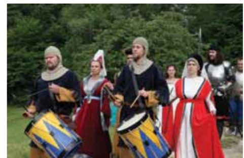
Srednjeveški dan na konjiškem gradu

Trg Bellecour v Lyonu, eden največjih francoskih mestnih trgov, se je v začetku meseca junija odel v številne barve sveta in zaživel v duhu bogate svetovne kulturne dediščine. Letos se je na enajstih Konzularnih praznikih predstavilo 53 držav, med njimi že (šestič) tudi Slovenija. Potekali so od 4. do 6. junija 2010, barve Slovenije pa je zastopala Občina Slovenske Konjice s partnerji.