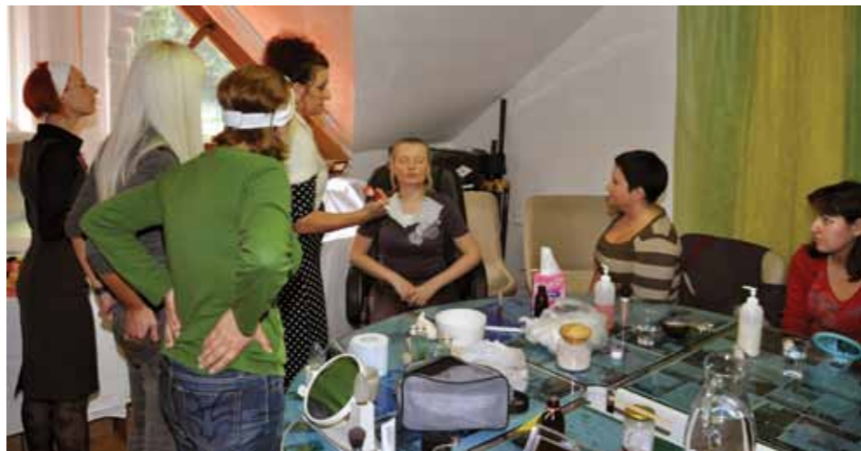
Umetnost ličenja v prostorih Zavoda za mladino Zreče

Vsak drug mesec izdajajo glasilo O'Mladinec, ki ga prejme vsako gospodinjstvo. Mlade motivirajo, da sami pišejo prispevke o dogodkih, sami pa tudi obveščajo, kakšne aktivnosti bodo prirejali. Pri mladih je zelo pomemben proces socializacije, zato želijo mlade spodbujati, da bi bili ustvarjalni in da bi koristno preživljali prosti čas. Tako organizirajo zanimiva potopisna predavanja, literarne večere, ustvarjalne delavnice, športne turnirje, glasbene koncerte, likovne razstave mladih umetnikov in športne taborje. Vse tisto, kar mladi radi počnejo in kar jim je blizu. V prostorih mladinskega centra je na voljo nekaj računalnikov, mladi lahko igrajo biljard, namizni tenis ali pa se pomerijo v namiznem nogometu.