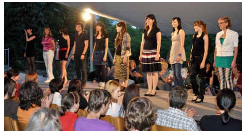
Mladi modni oblikovalci na zaključni prireditvi Tedna mode

MCŠ ima status organizacije, ki omogoča mladim, da v okviru EU programa Evropska prostovoljna služba, za 2 do 12 mesecev, odidejo v želeno EU državo ali izven ter kot prostovoljci sodelujejo pri