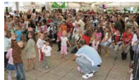
Noč pod kostanji