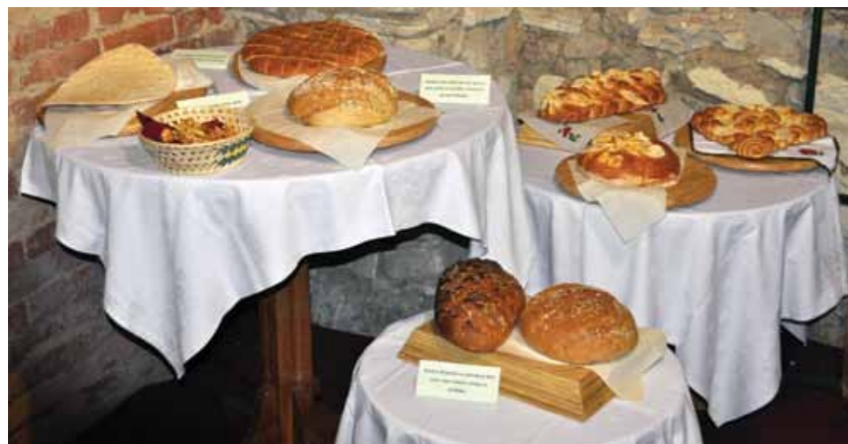
Pekovske dobrote z razstave "Naravno je zdravo" z letošnjega Šentjurjevega

Tudi v letošnjem letu Dobrčani nestrpno pričakujemo tradicionalno prireditev Noč pod kostanji. Vabljeni tudi obiskovalci od drugod, da se je udeležijo.