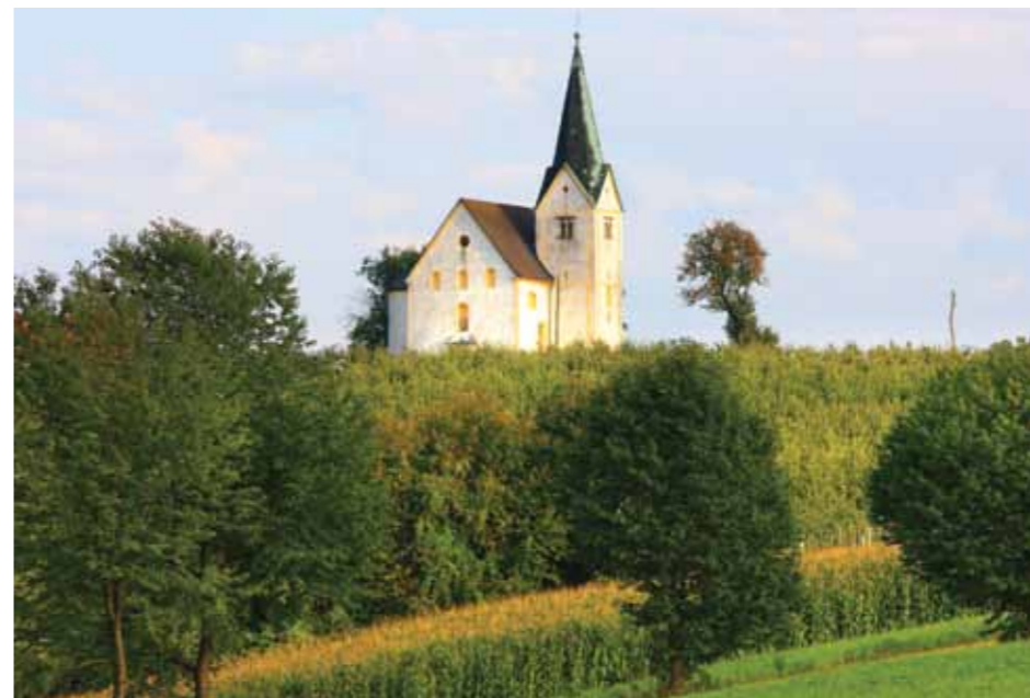
Ponkovške učne poti vodijo mimo idilične cerkve sv. Ožbolta

V okviru projekta se je uredila Vodovnikova zbirka v nekdanjem župnišču v Skomarju,