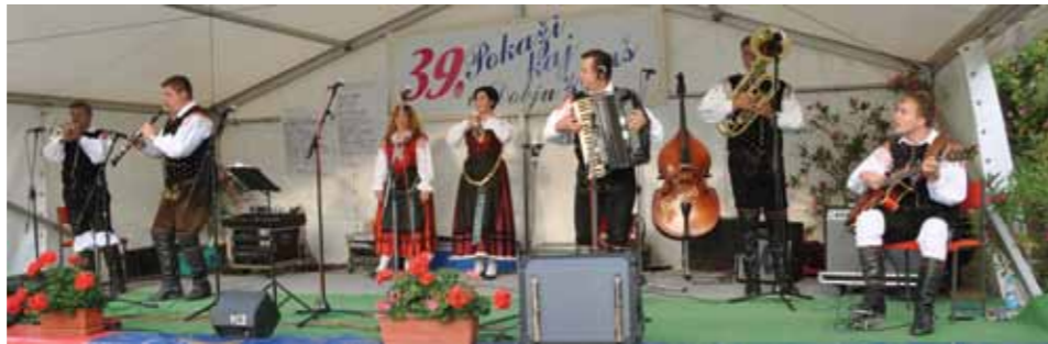
Pokaži kaj znaš

Glasbeno tekmovalna prireditev »Pokaži kaj znaš« je bila prvič organizirana leta 1972 in je najstarejša tovrstna prireditev v Sloveniji. V letu 2011 bo organizirana že 40. leto zapored. Takratna pobudnika in organiza-