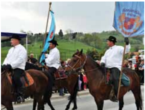
Konjeniško društvo Blagovna

Kulturno tradicijo šentjurskega društvenega življenja nadaljuje skoraj 30 kulturnih društev. Najštevilnejša so pevska društva, saj je zborovsko petje tudi tukaj najbolj množična dejavnost. Na vsakoletni reviji odraslih pevskih zborov in vokalnih skupin se tako zbere vsaj 12 pevskih skupin, ki v zadnjih letih dosegajo vidnejše uspehe, ne le v slovenskem, ampak tudi v mednarodnem merilu. Predvsem izstopa Mešani pevski zbor Zarja Akvonij iz Šentvida pri Planini, ki je v zadnjem letu prejel zlato priznanje na regijskem tekmovanju v Slovenj Gradcu, bronasto na državnem tekmovanju Naša pesem v