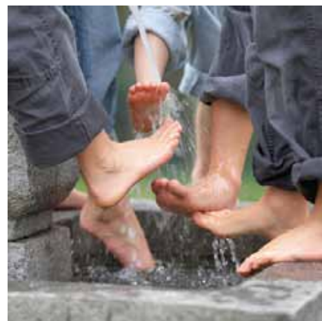
Kneipanje z mrzlo vodo

Cilj projekta je bil spodbujanje uporabe lokalnih virov na inovativen način z razvojem in promocijo kneippovih aktivnih parkov, ki omogočajo izkoristek neokrnjene narave in bogate kulturne dediščine tega območja. Izdelale so se tipske idejne zasnove za ureditev kneippovih aktivnih parkov, ki so na voljo potencialnim investitorjem.