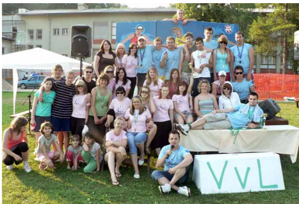
Člani Mladinskega kluba Dobrna

Ker vadba poteka z otroki iz prve triade se te aktivnosti popestrijo tudi z različnimi igrami, med katerimi se otroci sprostijo, veselijo in porabijo odvečno energijo. Poleg tega, da otroci uživajo se seveda učijo in pridobivajo nove gibalne izkušnje in utrjujejo svoje športno znanje, in sicer specifično atletsko kot