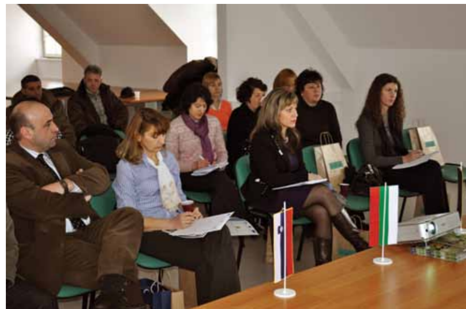
Predstavitve LAS bolgarskim predstavnikom

Podeželski parlament je orodje za učinkovit razvoj podeželja na Švedskem. Letošnji moto Parlamenta je bil: »Kjer se srečata mlada in starejša generacija, tam je razvoj«, saj le-ta sloni na izkušnjah odraslih in prodornosti mladih. Pri tem pa je pomembno, da se vsak posameznik zaveda odgovornosti za svoja dejanja, saj vsak in vsi prispevamo k razvoju podeželja z odgovornim razmišljanjem in delovanjem.