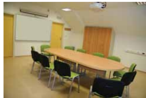
Sodobno opremljeni prostori za mlada podjetja

Omogočanje prostorskih pogojev in nudenje pomoči inkubiranim podjetjem je samo