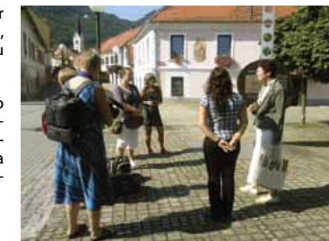
Švedske predstavnice raziskujejo Slovenske Konjice

Ponujen jim je bil pester program, nad katerim so bile navdušene, predvsem pa jih je