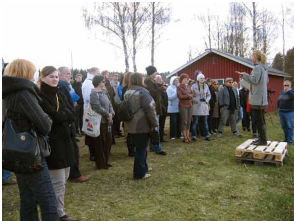
Iznajdljivost na švedski način

Zanimal jih je način organiziranja LAS – organov upravljanja in delovanja, način priprave razvojne strategije podeželja, turizma, iz-