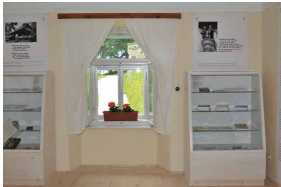
Vodovnikova zbirka v nekdanjem župnišču

Tržnica Vitanje je bila prvi uspešno izveden Leader projekt našega LAS. Vzpostavljena je bila kmečka tržnica, na kateri se s svojimi pridelki in izdelki predstavljajo tudi članice Društva kmečkih žena Lipa Vitanje.