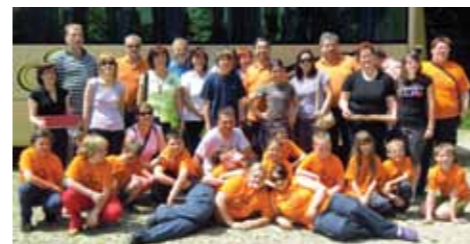
Mladi tekmovalci in njihovi navijači

Uspeh jim je vlil novih moči in nadaljevali so s trdim delom. Teden pred državnim tekmovanjem so tekmovali na domačem terenu, v Vitanju, in tudi tu pometli s konkurenco. Že drugič zapored so osvojili prehodni pokal Občine Vitanje, v ligaškem tekmovanju zveze pa so skupni zmagovalci že četrtič zapored (torej štiri leta nepremagljivi). Samo v letošnjem letu se lahko pohvalijo s tremi prehodnimi pokali.