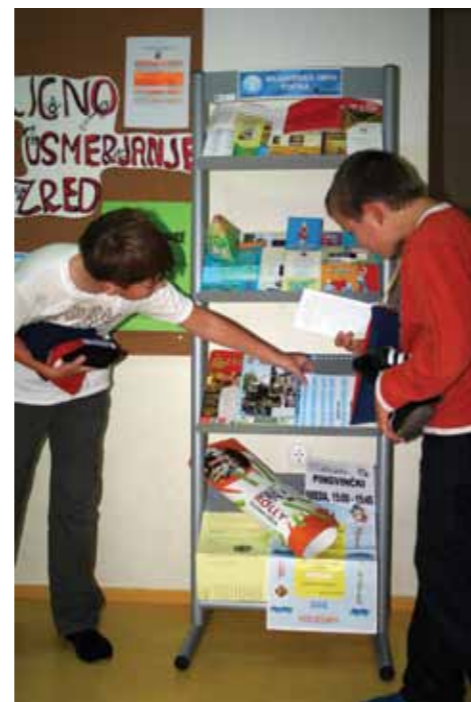
Informacijska stojala z gradivi na OŠ Blaža Kocena Ponikva

Cilj projekta je bil na podeželskem območju občine Šentjur, v posameznih krajevnih skupnostih, prebuditi mladostniški ustvarjalni potencial ter mladim omogočiti aktivno udeležbo pri soustvarjanju življenja v lokalni skupnosti, da začutijo pripadnost domačemu kraju.