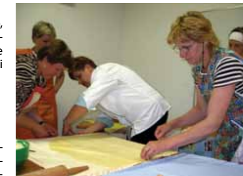
Recepti naših babic so vedno bolj iskani

V okviru tega projekta so bili izvedeni številni programi usposabljanj z različnimi temami: ohranjanje podeželja, iskanje tržnih poti na kmetijah, okoljske delavnice, kulinarika nekoč in danes, komunikacija z gosti, tečaji v tujem jeziku, računovodstvo, restavriranje, ročno kovanje, ročno in strojno šivanje. Osnovni namen projekta je tako usmerjen v izvedbo programov usposabljanj, z namenom dvigniti raven usposobljenosti ter spodbujati izobraževanje in vseživljenjsko učenje na območju LAS.