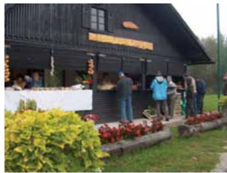
Vitanjske domače dobrote naprodaj

Tržnica Vitanje je bila prvi uspešno izveden Leader projekt našega LAS. Vzpostavljena je bila kmečka tržnica, na kateri se s svojimi pridelki in izdelki predstavljajo tudi članice Društva kmečkih žena Lipa Vitanje.