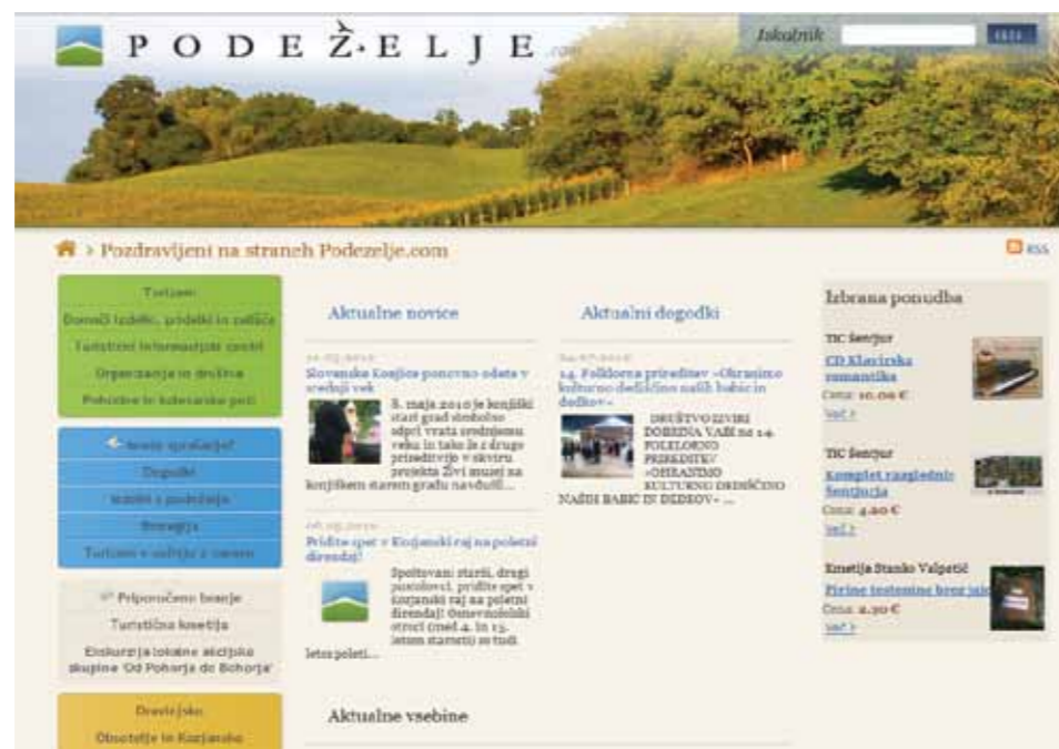
Spletno mesto www.podezelje.com

V okviru projekta se je vzpodbujalo razvijanje računalniških veščin podeželskega prebivalstva z uporabo internetnega portala www.podezelje.com . Nadgrajen je bil tudi spletni portal Podezelje.com , kjer imajo možnost svoje predstavitve podeželski ponudniki z območja LAS.