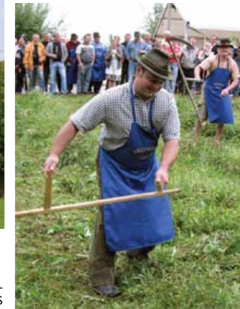
Kosca na delu

V okviru projekta je bil uspešno izveden Teden starih obrti in običajev v Dobju, izdelan je bil register mojstrov starih obrti in običajev v Dobju z evidentiranimi še ohranjenimi stariimi znanji, obrtni, opravili in običaji.