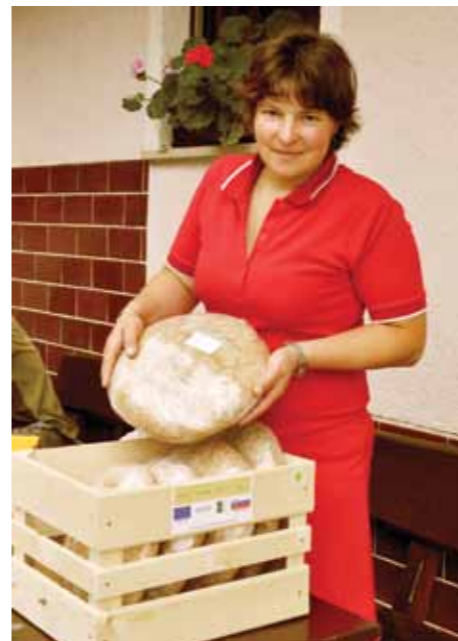
Prodaja domačih izdelkov na mobilni tržnici

Namen projekta Mobilna lokalna tržnica je bil na inovativen način v praksi vzpostaviti testno lokalno samooskrbo z živili. Na ta način se ponudnikom omogoča prodaja njihovih pridelkov/izdelkov, poveča konkurenčnost, hkrati pa se spodbudi razvoj podeželja.