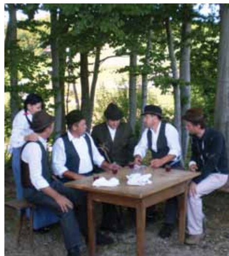
Guzaj jih je še v prevorskem gozdčku okrog prinesel

Lokalna skupnost tradicionalno organizira pohod, ki vključuje kraje, povezane z Guzajevim življenjem. Odločili so se za razširitev poti in njeno promocijo, ki bo omogočala večjo prepoznavnost lokalnega okolja in njeno predstavitev širšemu krogu ljudi.